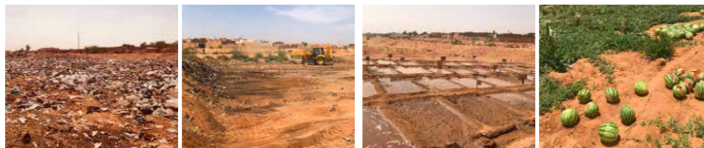
Métamorphose de l'oued dans Agadez [Niger]

Il intervient comme Fonds de distribution, c'est-à-dire de soutien financier vers d'autres organismes reconnus d'intérêt général, mais il peut aussi apporter une assistance opérationnelle directe comme il le fait depuis plusieurs années en Mauritanie ou au Niger.