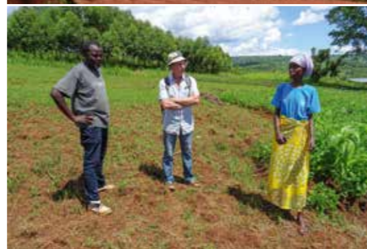
Réseau des Agréologues sans Frontière au Rwanda : Étude pour la mise en place d'une ferme de production pédagogique et expérimentale en agroécologie/agroforesterie du centre Humura.