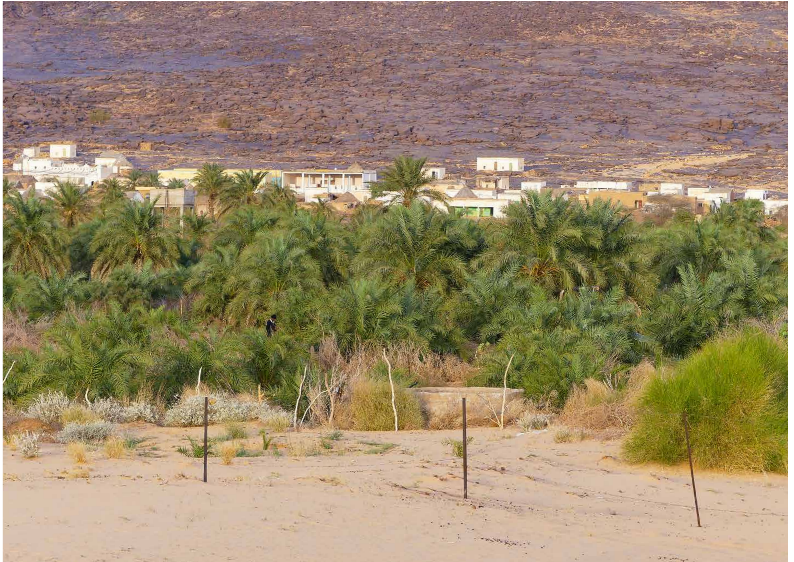
Village de Maaden (Mauritanie)