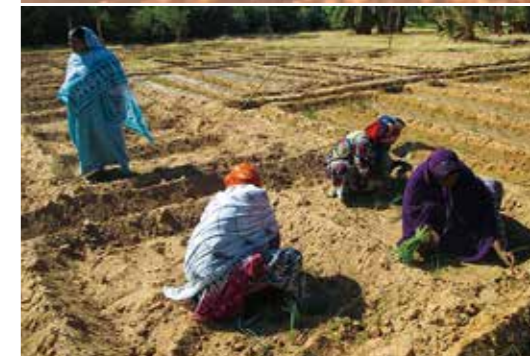
ONG Amadal Amagal : Autonomie et éducation au Niger